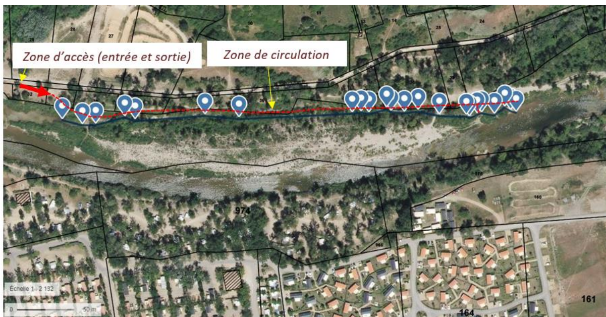
Figure 3 : Chemin emprunté pour accéder à la zone de chantier.

Les travaux ont été réalisés sur une demi-journée. Ils ont permis de reconnecter l'annexe hydraulique au Verdon par l'amont et de rétablir la continuité écologique et l'écoulement au sein même du chenal.