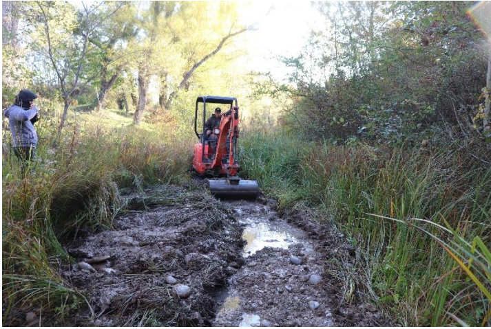
Figure 5 : Réouverture du secteur n°5.