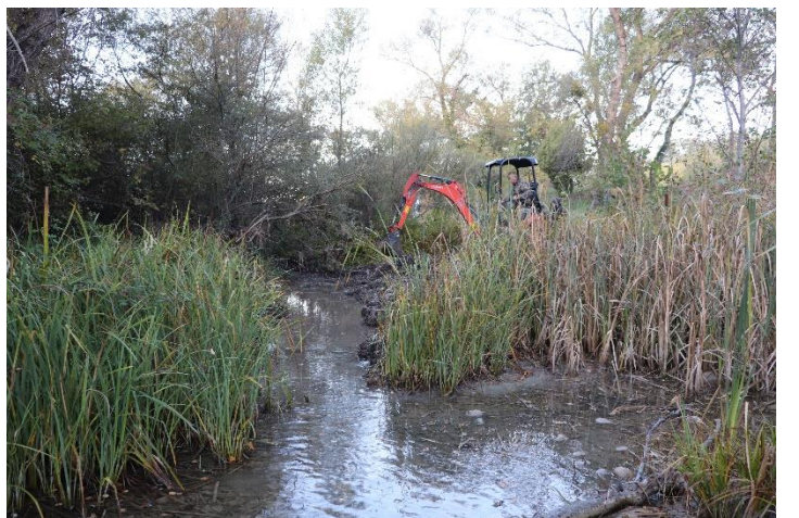
Figure 9 : Réouverture du secteur n°6 (avant et après travaux, vue par l'amont).