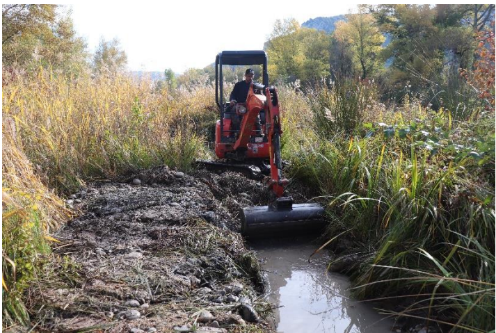
Figure 7 : Recréation du chenal sur les secteurs 2 et 3.