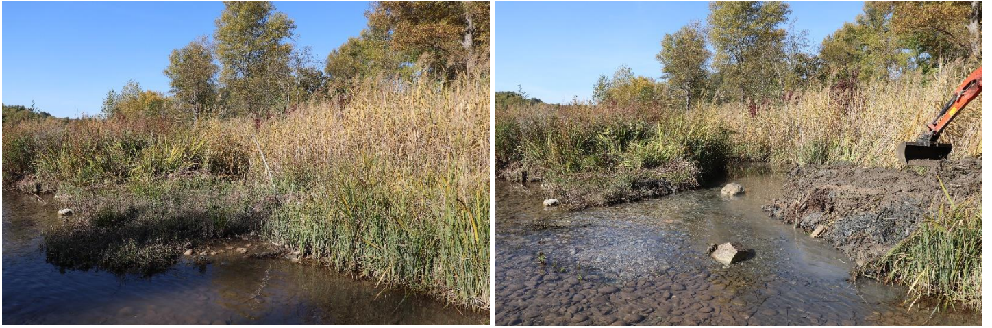
Figure 13 : Réouverture du secteur n°1 (avant et après travaux, vue par l'amont).