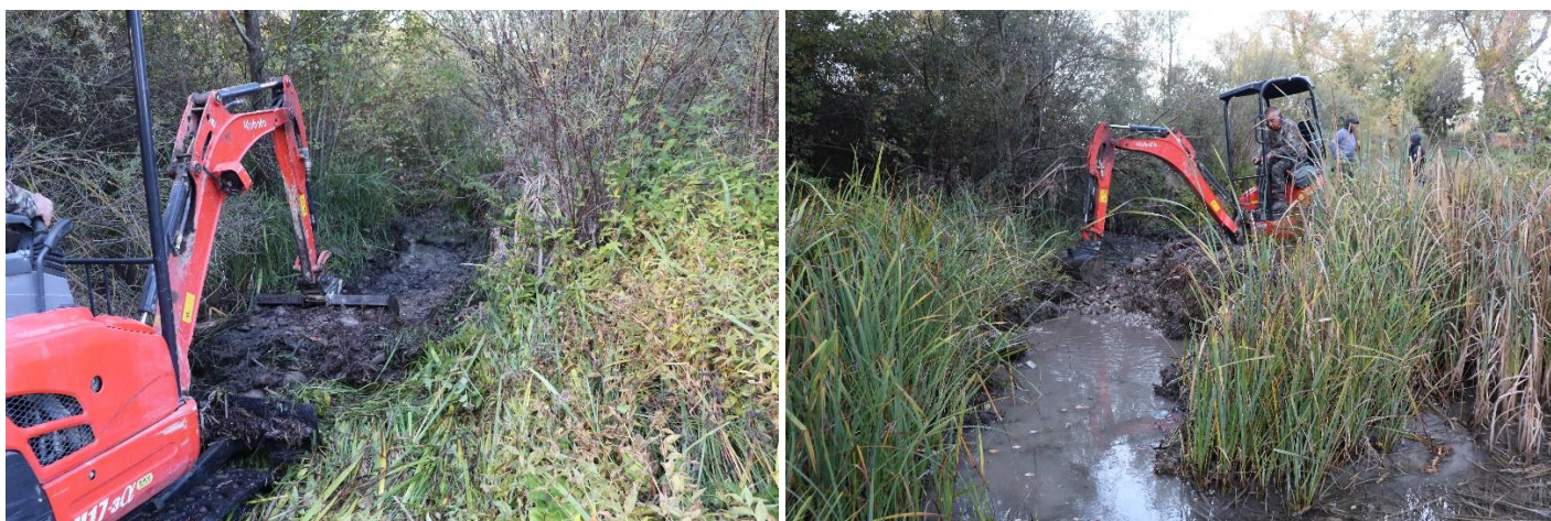
Figure 4 : Réouverture du secteur n°6 et régulation des matériaux en rive droite.