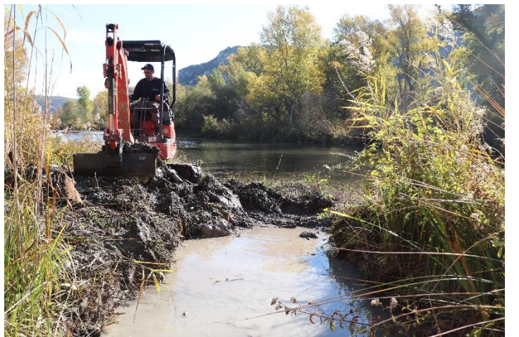
Figure 8 : Reconnexion avec le Verdon sur le secteur n°1.