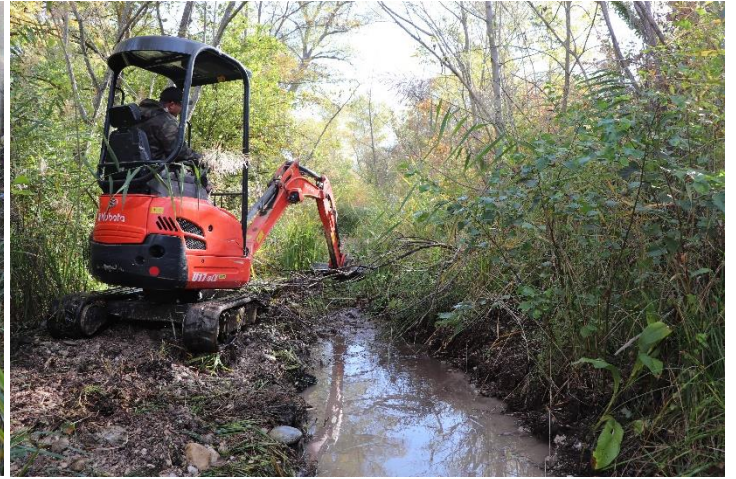
Figure 6 : Réouverture du secteur n°4.