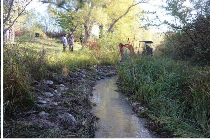
Figure 10 : Réouverture du secteur n°5 (avant et après travaux, vue par l'aval).