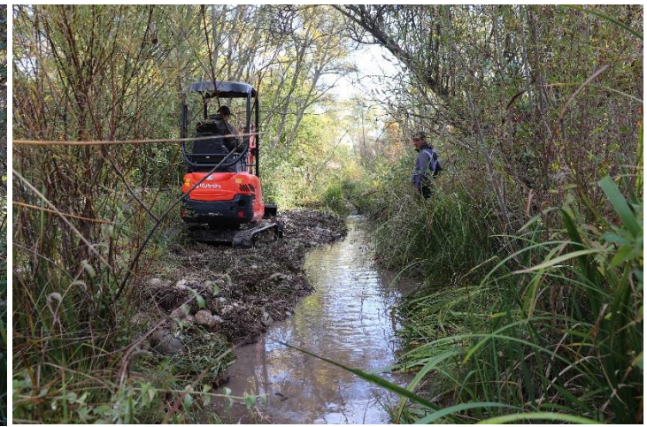
Figure 11 : Réouverture du secteur n°4 (avant et après travaux, vue par l'aval).