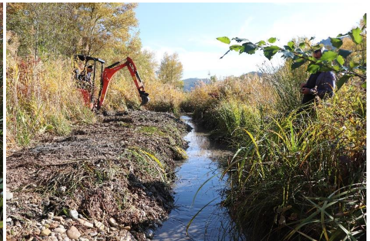
Figure 12 : Réouverture des secteurs n°3 et 2 (avant et après travaux, vue par l'aval).